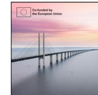
1:1 format (Instagram or facebook post)